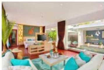
▲ 리프 짐바란(The Leaf Jimbaran) 객실 사진

[여성소비자] 리프는 10월의 그랜드오픈을 앞두고 있는 발리의 더 리프 짐바란(The Leaf Jimbaran)이 다음달 중에는 건강관 리프를 공개하게 될 것이다.