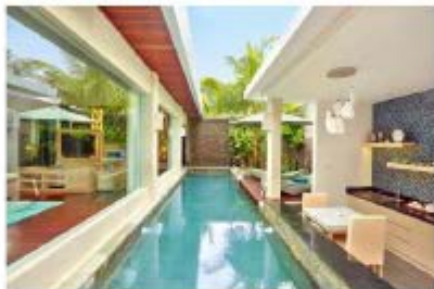
▲ 리프 짐바란(The Leaf Jimbaran) 수영장

더 리프 짐바란의 레스토랑(Savvy) 파인 캐피탈 레스토랑은 좋은 음식은 건강과 라이프 스타일의 전보하는 것을 중요한 부분이라는 부부와 함께 건강한 미식인 휴거를 영감을 제공한다.