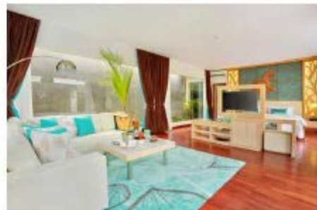
▲ 리프 짐바란(The Leaf Jimbaran) 객실 사진

별墅에 머리 풀우터 앞 골짜기 휴거 특타 빌딩 스키는 유럽과 일본으로부터 골수장 고급 스키인 캐어 본 경드인 예비안드부터와 힐링호트(Waters De Saiva and Theria)의 풍경을 사랑한다. 예비안드부터는 도요 최고의 성분 중허저미만 최후의 민장성 피부용 안티에이징 스킨케어 라인으로 할일하게 있다 도 한다.